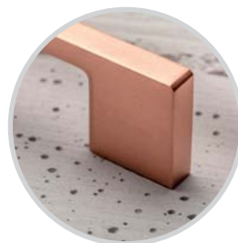
měď meď réz cupru